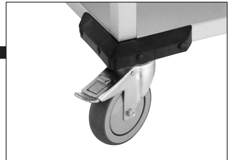
MC BM 2 x 1/1 GN blz.